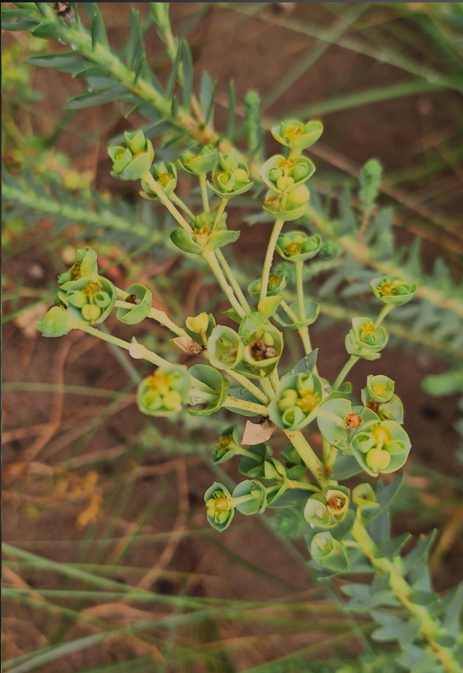
Euphorbia paralias Euphorbiacées