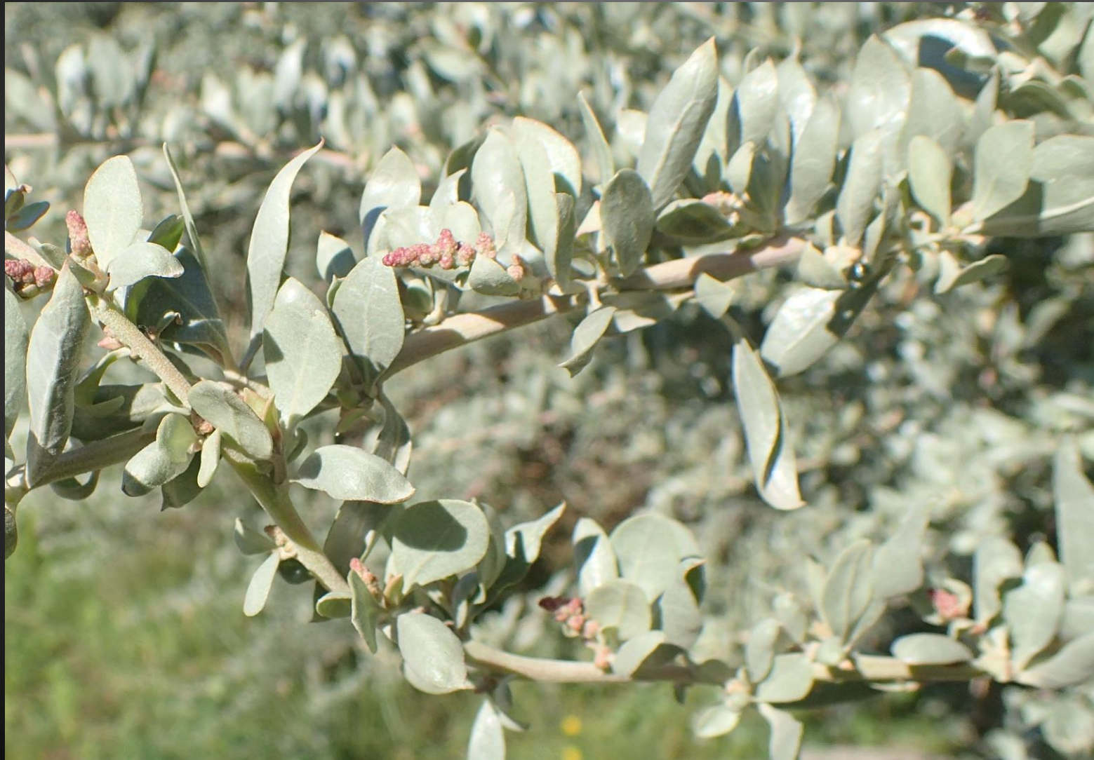
Atriplex halimus Amarantacées