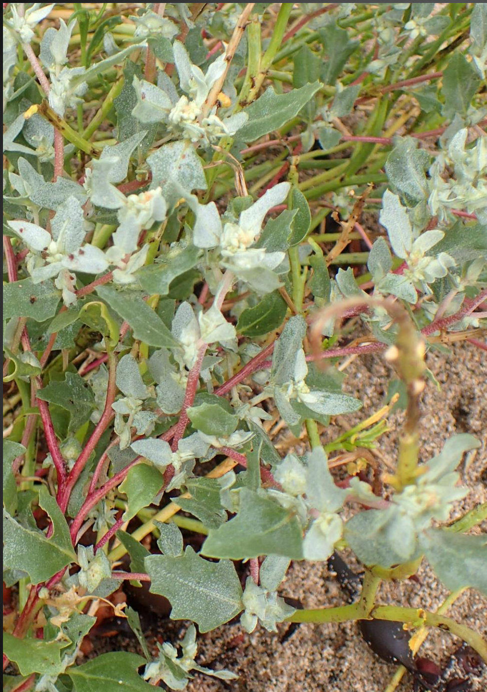
Atriplex laciniata Amarantacées