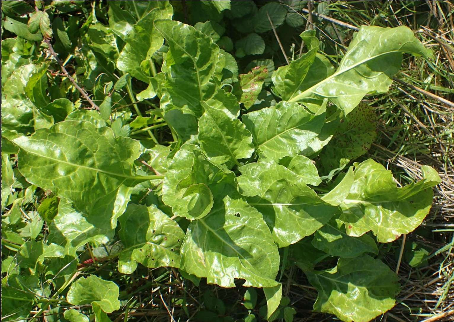
Beta vulgaris subsp. maritima Chénopodiacées