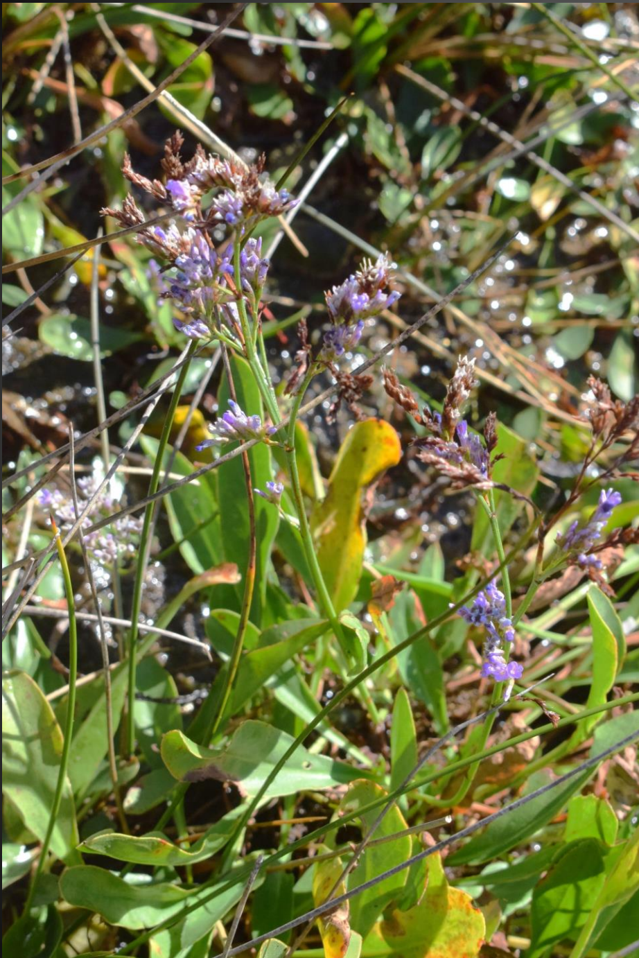
Limonium sp. Plombaginacées