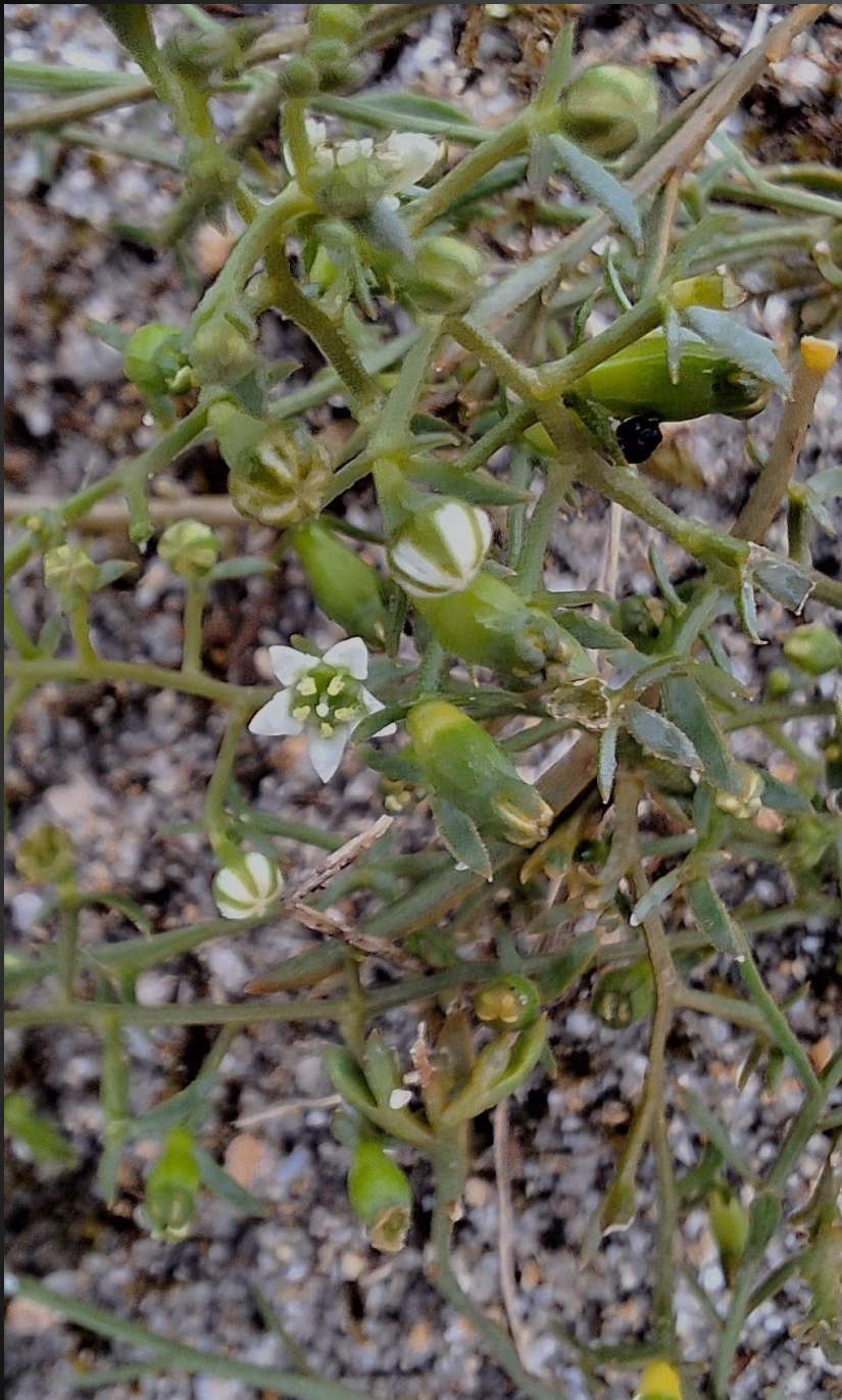
Thesium humifusum Santalacées