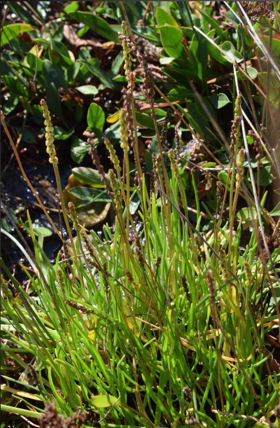
Triglochin maritima Juncaginacées