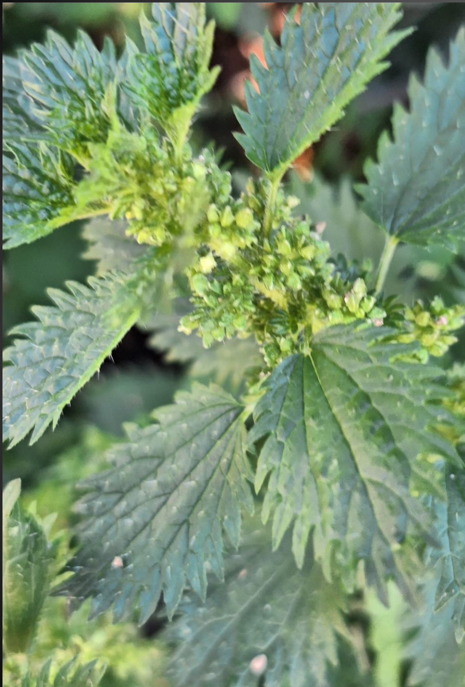
Urtica urens Urticacées