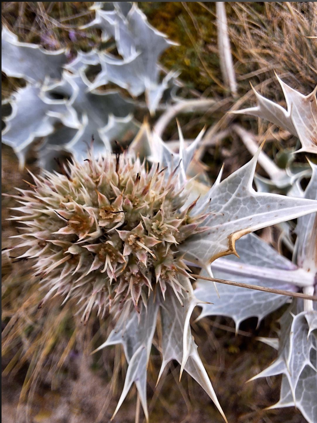
Eryngium maritimum Apiacées