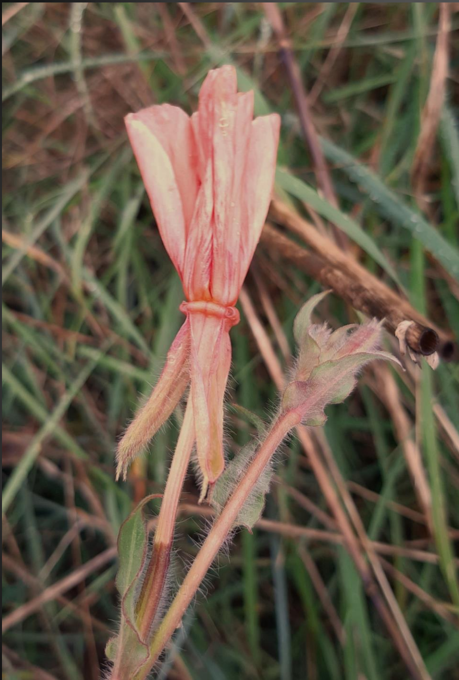
Oenothera stricta Onagracées