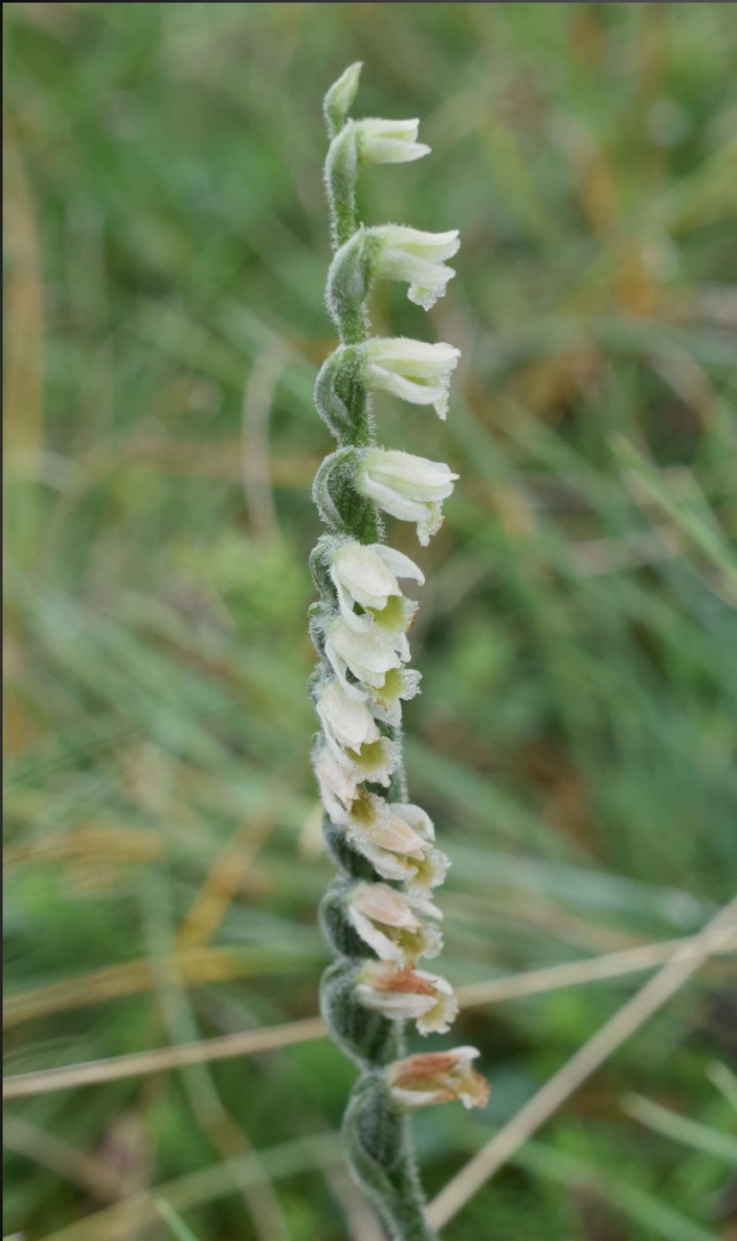
Spiranthes spiralis Orchidacées