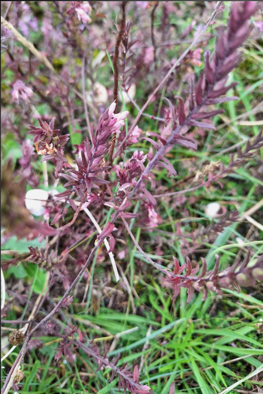
Odontites vernus subsp. serotinus Orobanchacées (ex Scrophulariacées)