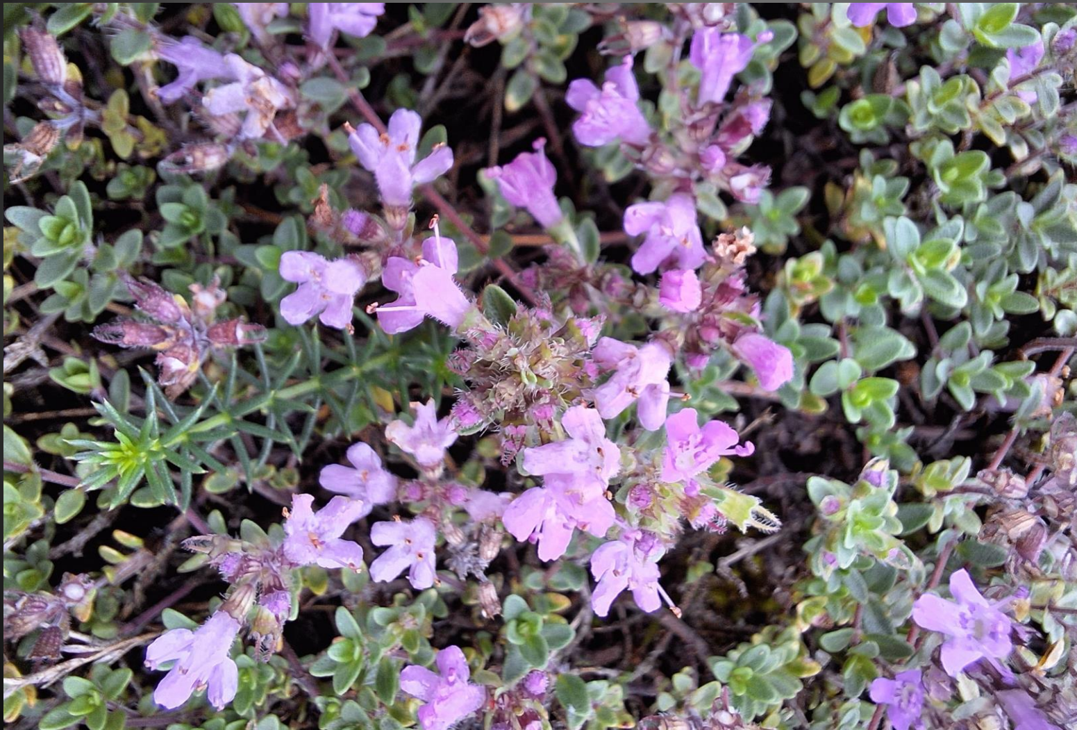
Thymus serpyllum Lamiacées